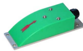
MAG-Flow OG- P

Zur Messung der Fließgeschwindigkeit und des Füllstands wird der Sensor MAG-Flow OG-P eingesetzt