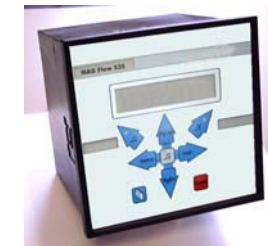
UFM 535 Schalttafeleinbau

Ebenso ist ein Ausgang zur zeitlichen oder mengenabhängigen Ansteuerung eines Probennehmers integriert.