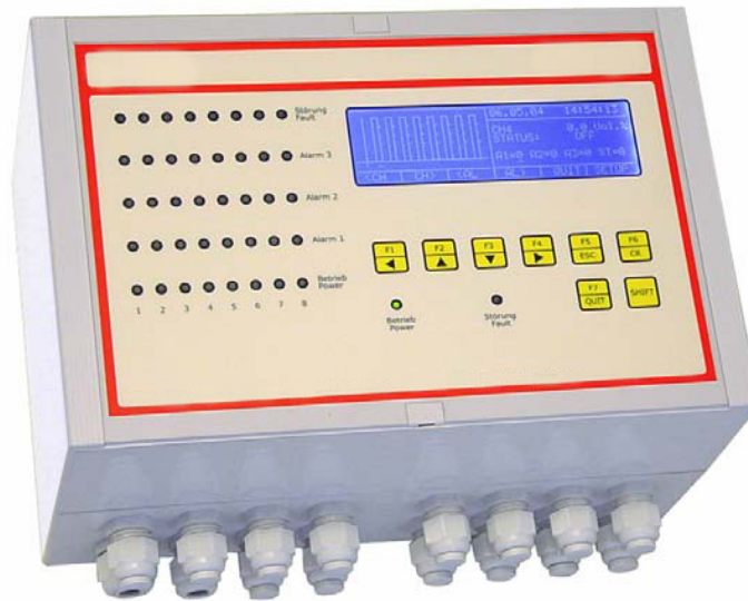
(Das Foto zeigt die Version im Wandaufbaugeschäft)

Beschreibung : Gaswarnzentrale zur Messung brennbarer und/oder toxischer Gase sowie Sauerstoff. Grafikdisplay. 3 Alarmschwellen pro Kanal. 24 frei konfigurierbare Relais. 8 Analogausgänge.